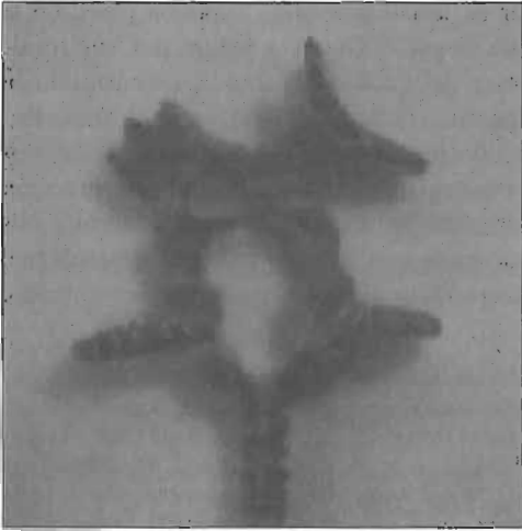
4. Mango del osculatorio de bronce, con representación de un gamo sobre dos pájaros enfrentados por los picos.