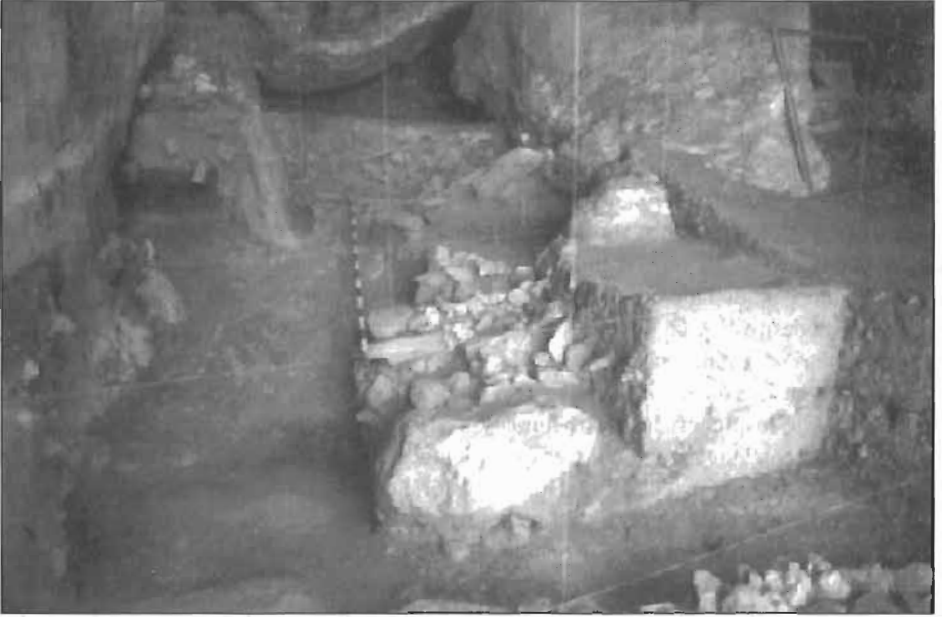
3. Excavación del área de basurero de época tardorromana.