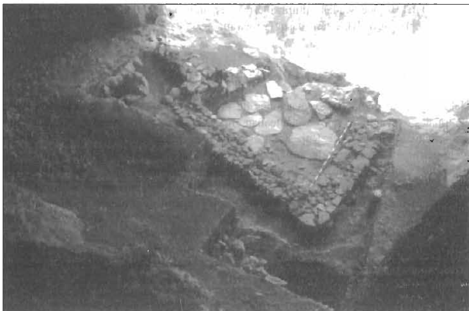
2. Estructuras tardorromanas de La Serreta. En primer término, Habitación A; al fondo, Habitación B.