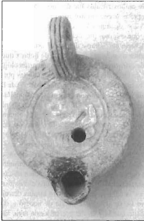
6. Lucerna de la serie 2T1, con representación de escena erótica heterosexual en el disco.