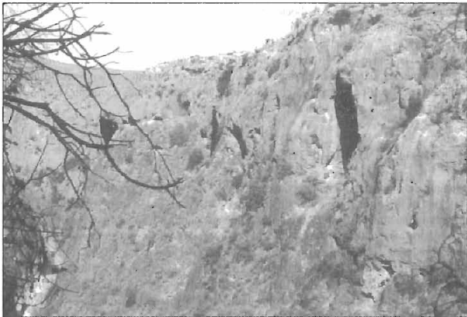
1. Vista general del cañón de Los Almadenes. En primer término, La Serreta.