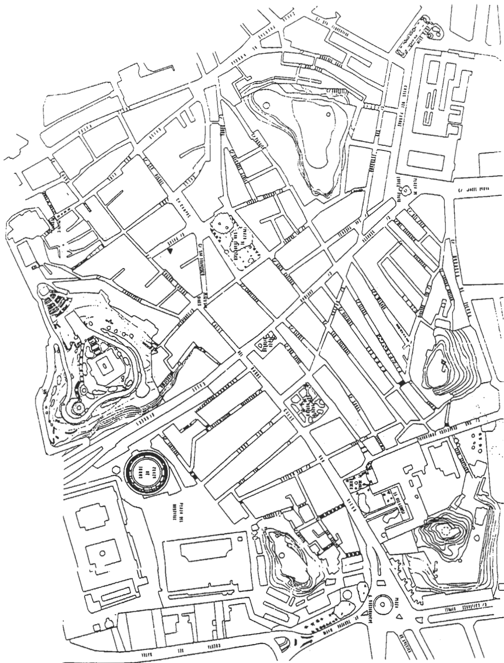
Figura 1. Localización de la intervención.